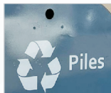
Boca lateral per a dipositar piles usades