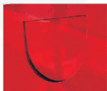
Boca frontal per a dipositar oli domèstic

L'Ajuntament de Llinars del Vallès aposta per la separació de residus instal·lant PUNTS ESPECÍFICS DE RECOLLIDA d'olis vegetals domèstics residuals i piles usades.